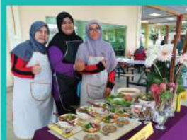
19. JAGUH MASAK PTSB 2019 (PUSPANITA)