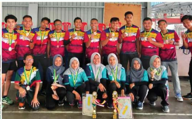
KEJOHANAN BOLA TAMPAR B20 TERBUKA KEDAH 2019