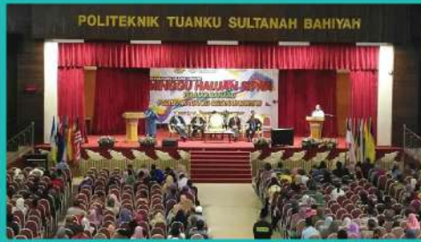
22. KEMASUKAN PELAJAR BAHARU SESI JUN 2019 [23 JUN 2019]