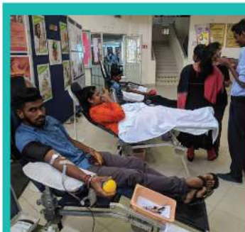
13. KEMPEN DERMA DARAH & PAMERAN KESIHATAN