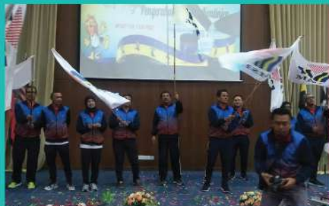
25. FLAG OFF KONTINJEN MAJLIS SUKAN POLITEKNIK KE SIPMA 2019

MALAYSIA POLYTECHNIC ENGLISH FESTIVAL 2019