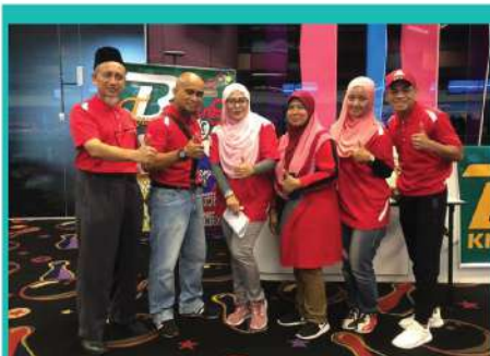
12. KITA BOWLING TOURNAMENT 2019