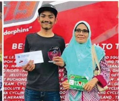
KULIM INTERNATIONAL MOUNTAIN BIKE 2019 TEMPAT KE-7 [JR RACE] TEMPAT KE-28 [JOVERALL]