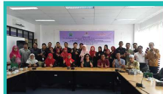
14. LAWATAN BALAS & PENANDA ARAS DELEGASI POLITEKNIK TUANKU SULTANAH BAHYAH(PTSB)