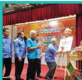
8. KARNIVAL MY BEST BUY & JUALAN TERUS DARI LADANG