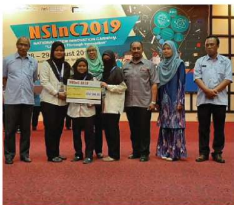
NATIONAL STEM INNOVATION CARNIVAL (NSINC) 2019 PROJEK INOVASI : PAC-MATHS IN ACTION