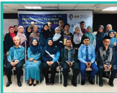
4. IN COUNTRY PROGRAM: REDESIGNING TEACHING & LEARNING PRACTICES TOWARDS IR 4.0