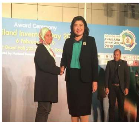
BANGKOK INTERNATIONAL INTELLECTUAL PROPERTY, INVENTION, INNOVATION & TECHNOLOGY EXPOSITION 2019 2 PERAK & 1 GANGSA