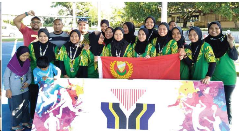
BOLA JARING - KARNIVAL MSPM-26 NAIB JOHAN