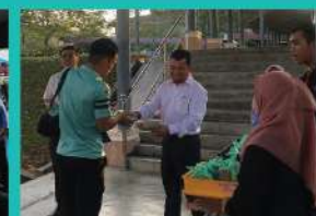
21. PROGRAM SARAPAN MINDA INTELEK