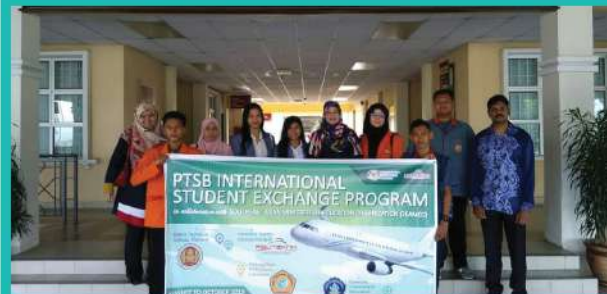
24. PROGRAM PERTUKARAN ANTARABANGSA DARI PATTANI TECHNICAL COLLEGE, UNIVERSITAS GANESHA, BALI & POLITEKNIK NEGERI PADANG. [OGOS 2019]