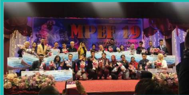
23. (MPEF 19)

MALAYSIA POLYTECHNIC ENGLISH FESTIVAL 2019