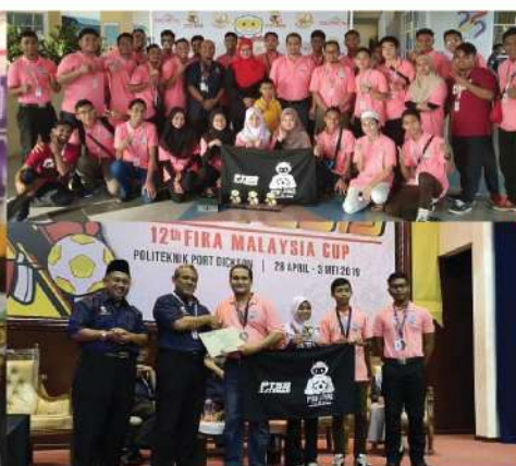
12th FIRA MALAYSIA CUP 2019 1 EMAS & 2 PERAK