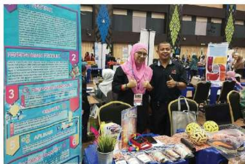
International Bujang Valey Innovation, Invention & Design Competition 2019 EMAS