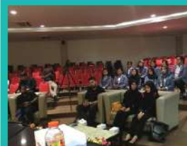
26. PROGRAM PERTUKARAN PELAJAR PTSB KE UNIVERSITAS PENDIDIKAN GANESHA, BALI AND POLITEKNIK NEGERI PADANG INDONESIA. [OGOS 2019]