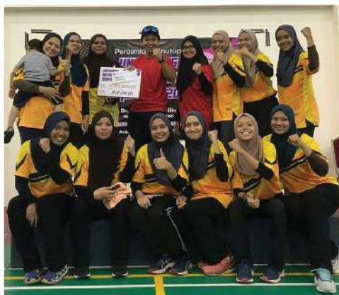
UNISHAM NETBALL OPEN 2019