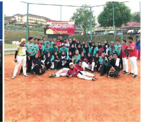
KEJOHANAN SOFBOL SLOWPITCH POLITEKNIK MALAYSIA 2019 TEMPAT KE-3