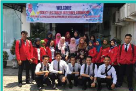
1. PROGRAM PERTUKARAN PENSYARAH PTSB - STIM SUKMA MEDAN