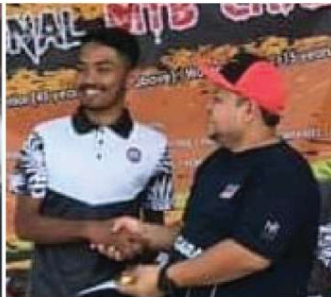
SINTOK INTERNATIONAL MTB CHALLENGE 2019 TEMPAT KE-4