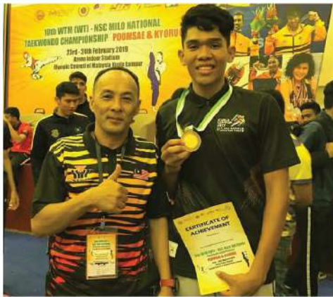
10th TM (WTF) NATIONAL TAEKWONDO CHAMPIONSHIP 2019 TEMPAT KE-3