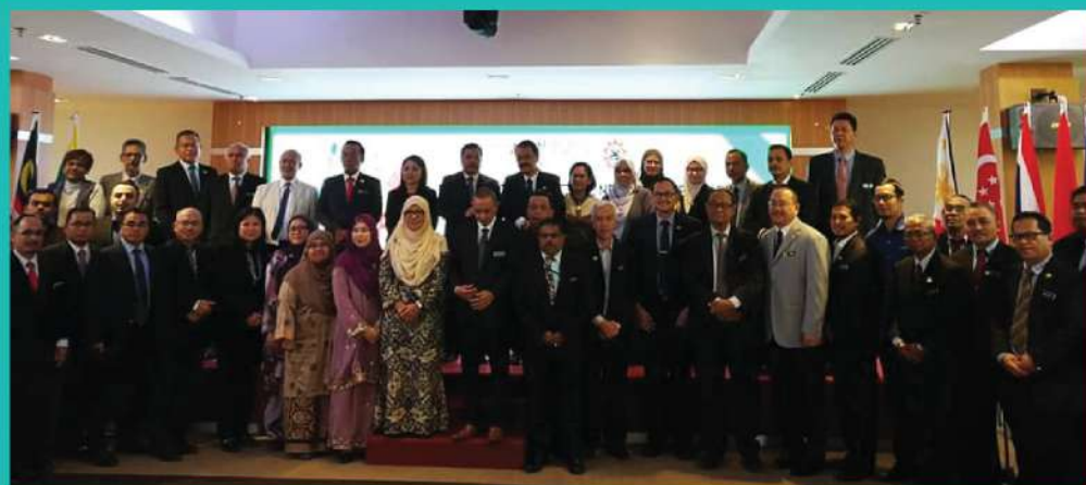
6. 5th SEAMEO POLYTECHNIC NETWORK MEETING 2019