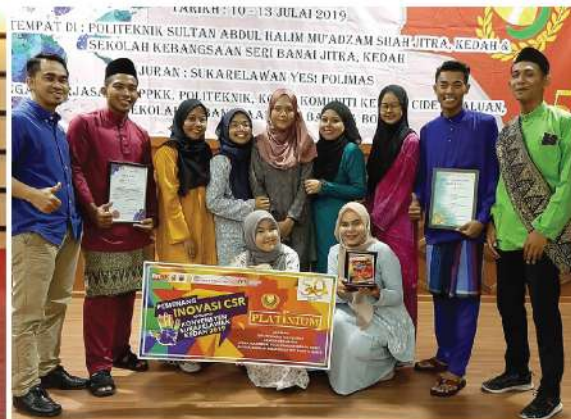
KONVENSYEN SUKARELAWAN POLITEK DAN KOLEJ KOMUNITI NEGERI KEDAH 2019