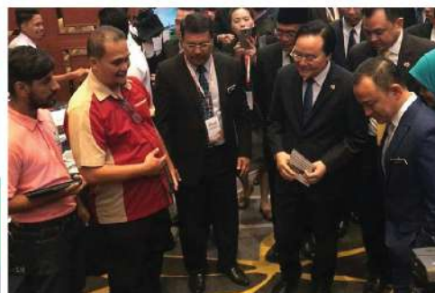
PTSB terpilih ke pameran sempena Persidangan Majlis Pertubuhan Menteri-Menteri Pendidikan Negara Asia Tenggara ke-50 (SEAMEO Council Conference 2019) Sunway Hotel, Petaling Jaya