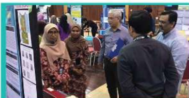
5. iCE V7 (INVENTION COMPETITION & EXHIBITION 2019)