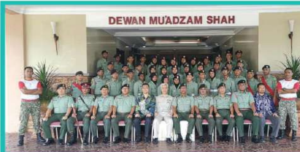
16. KURSUS WATANIAH PTSB - BATALION 2 REJIMEN 513