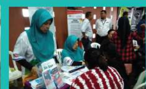
11. TEAM PTSB KE SEKOLAH-SEKOLAH SEKITAR KULIM, BANDAR BAHARU, SUNGAI PETANI, SIK & KUALA MUDA SEMPERNA PENGUMUMAN KEPUTUSAN SPM BAGI MEMPROMOSIKAN KEMASUKAN KE POLITEKNIK.