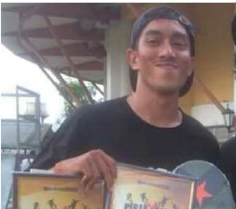
PERAK X GAMES CHALLENGE CARNIVAL 2019 [SKATEBOARD OPEN PARK EXPERT] TEMPAT KE-4