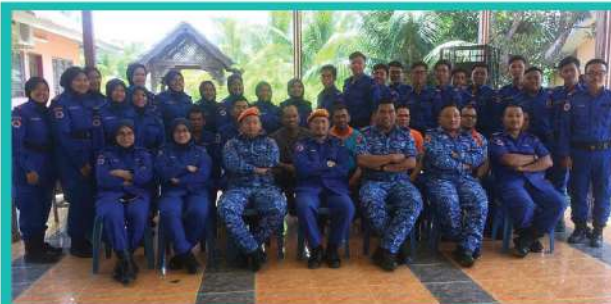
17. PISPA PTSB KURSUS PENGENDALIAN BOT RINGANTASIK BERIS, SIK