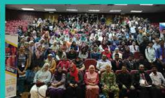
20. MPCEP 19 MALAYSIAN POLYTECHNIC COMMUNICATION ENHANCEMENT PROJECT 2019