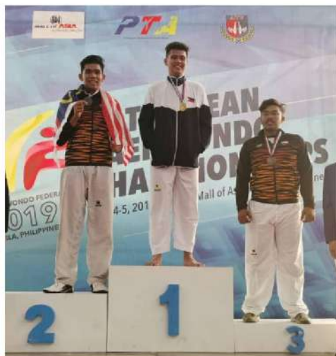
14th ASEAN TAEKWONDO CHAMPIONSHIP, MANILA PERAK