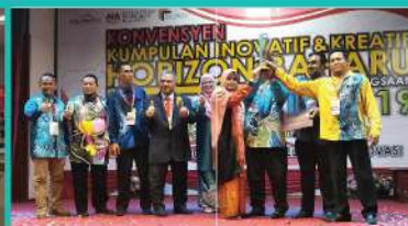
27. KONVENSyen KUMPULAN INOVATIF & KREATIF HORIZON BAHARU PERINGKAT KEBANGSAAN