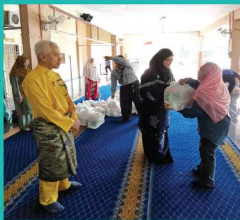
15. MAJLIS PENYERAHAN SUMBANGAN BARANGAN KEPADA SEMUA PEKERJA PEMBERSIHAN DAN KESELAMATAN, PTSB.