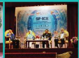
28. SP-ICE 2019