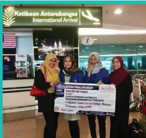
18. PROGRAM PERTUKARAN PELAJAR ANTARABANGSA DARI UNIVERSITI MUHAMMADIAH PUWOKERTO, INDONESIA [13 FEB – 10 MAC]