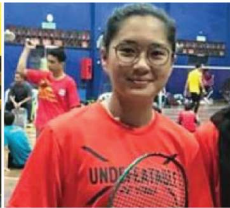
POLYTECHNIC RACKETLON CHAMPIONSHIP 2019 GANGSA (Beregu Wanita)