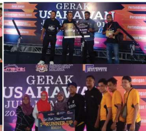
SAMBUTAN JUBLI EMAS POLITEKNIK MALAYSIA NAIB JOHAN (ESport - Gerak Usahawan) NAIB JOHAN (Zorb Ball - Gerak Usahawan)