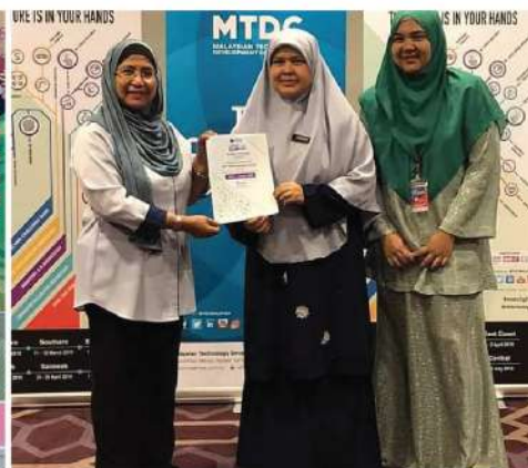
PITCHING CONTEST [IPT] MTDC ROAD2GROWTH PENANG TEMPAT KE-3