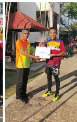
PERLAWANAN BOLA TAMPAR JEMPUTAN LELAKI LIGA KOTA VC 2019