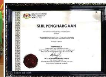
PENGGUNAAN TERTINGGI PERISIAN TURNITIN POLITEKNIK & KOLEJ KOMUNITI