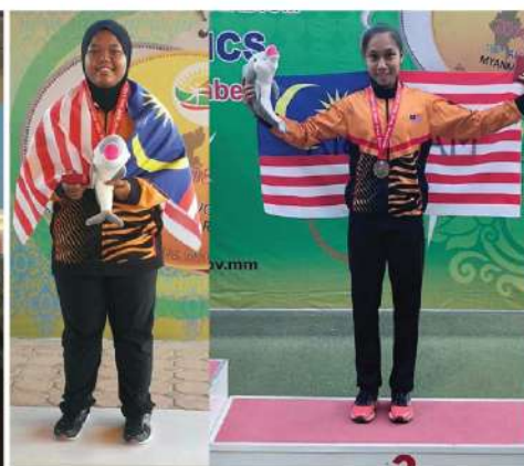
ASEAN UNIVERSITY GAMES DESEMBER 2018 3 GANGSA (Petanque, 300m & 400m)