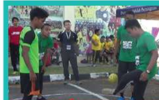
10. POLYLIMPIK PTSB 2019