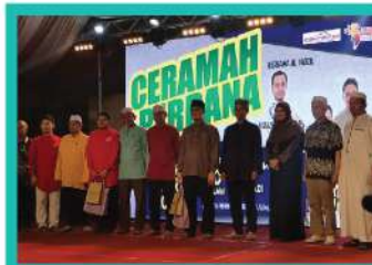
9. KARNIVAL RAPAT RAKYAT