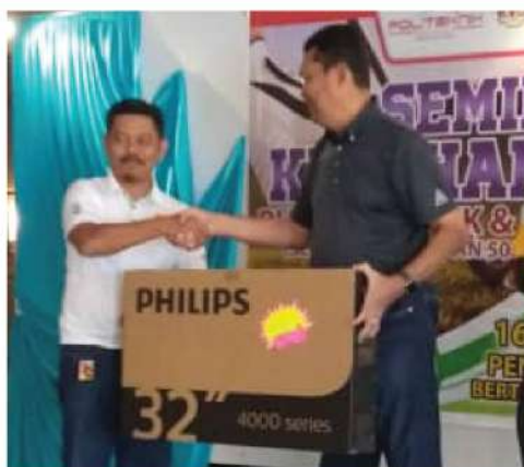
JOHAN (Kategori staf) - Kejohanan Golf Piala KP JPPKK & YDP MSP 2019